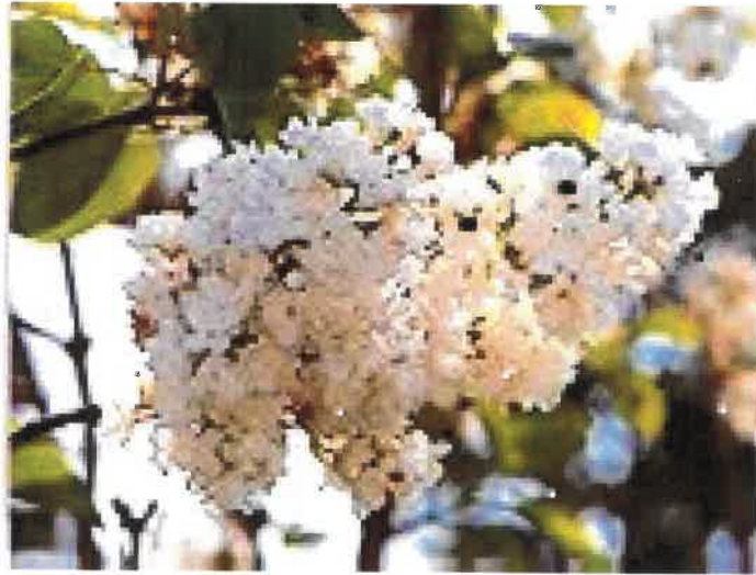
町の花 … ライラック